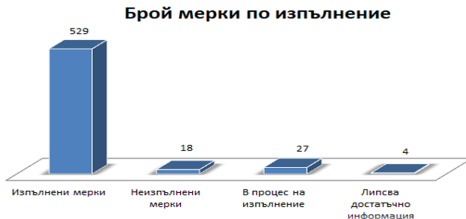
Графика № 1.

Изпълнение на мерките. Настоящият анализ обхваща информация за общо 578 планирани антикорупционни мерки, в т.ч. ведомствата сочат подробни данни за „изпълнение“ на 529 и данни/причини за „неизпълнение“ на 18 мерки. Двадесет и седем мерки са отчетени „в процес на изпълнение“ или „частично изпълнение“, подкрепени с конкретни кадрови, вътрешноорганизационни, технически и извънредни причини. Не са отчетени 4 мерки, за които „липсва (достатъчно) информация“. (Графика № 1)